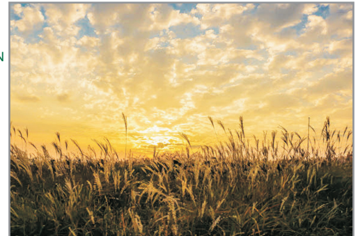
《增遊》首爾天空公園(賞紫芒草註1) (10月1日至11月30日出發團隊適用)