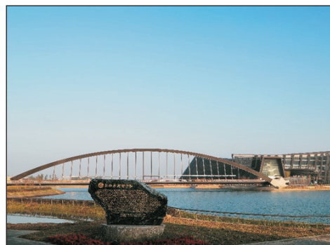
國立故宮博物院南部園區