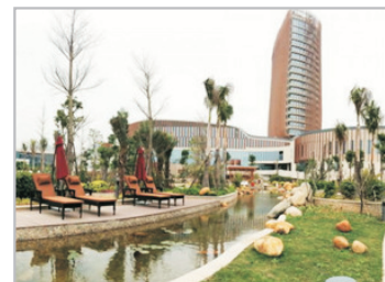
佰翔圓山溫泉酒店