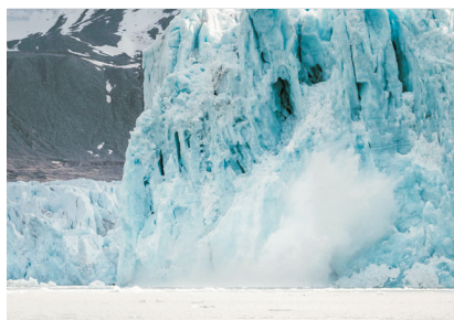
斯匹茲卑爾根西北國家公園