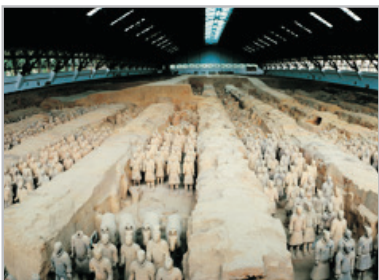
~秦始皇兵馬俑博物館~

【舒適住宿】全程入住國際品牌五星級標準《獨家》西安君樂城堡酒店(Grand Park Xian)，外型氣勢磅礴、媲美古代宮殿。酒店地理位置優越，鄰近多個景點、餐廳，離地鐵站僅數分鐘步程，方便自行外出遊覽。