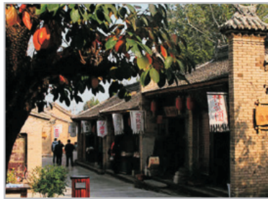
~袁家村關中印象體驗地~

被譽為世界第八大奇蹟及被評為《世界文化遺產》的秦始皇兵馬俑，放滿了一排排如同真人般高大的陶質武士俑及車馬俑，其創作氣魄之大，可稱世界一大奇景。置身其中，猶如穿越二千年的秦皇歷史。