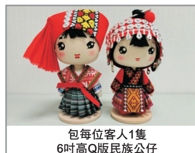
包每位客人1隻 6吋高Q版民族公仔

* 惠水至好花紅千戶布依寨，車程約1小時； 好花紅千戶布依寨至平塘，車程約2小時。