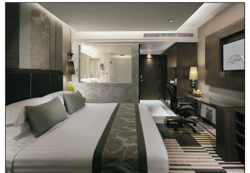
The Landmark Bangkok Hotel