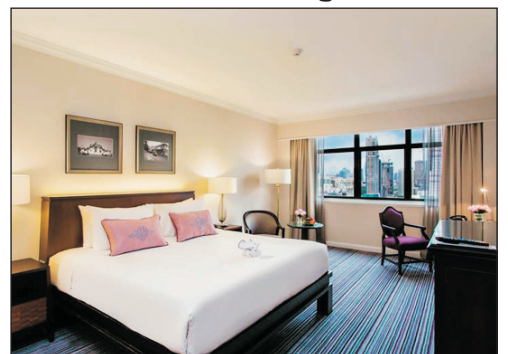
The Sukosol Bangkok Hotel