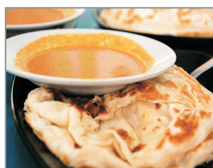
👍印度風味~印度煎餅+拉茶