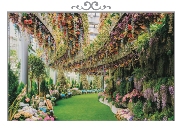
Gardens by the Bay~ Floral Fantasy