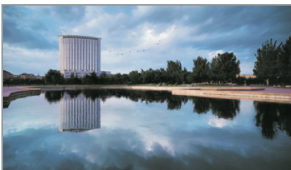
包頭香格里拉酒店