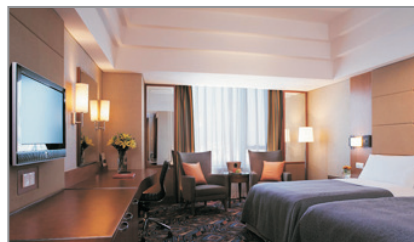
包頭香格里拉酒店