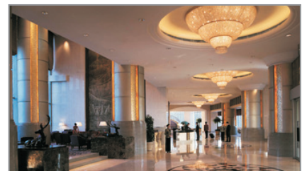
包頭香格里拉酒店