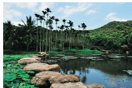
呀諾達熱帶雨林文化園