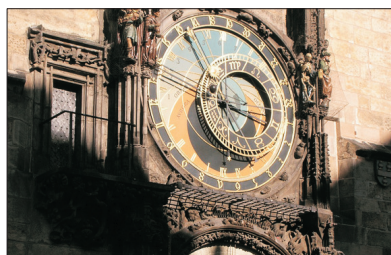
「精雕細琢的古老之作」 布拉格天文鐘

位於維也納市中心環城大道內的王宮建築群，既是歷代奧地利皇帝的冬宮，亦是世界聞名之維也納兒童合唱團的表演場地。荷夫堡建築風格獨特，有哥德式、文藝復興式，以及巴洛克式等，美麗而輝煌。