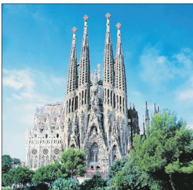
「未完成的宏偉藝術」 聖家族教堂

細意為每位貴賓安排「隨身導賞耳機」於當地使用，方便聆聽工作人員講解，輕鬆自在投入精彩旅程！