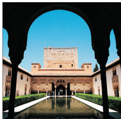
「西班牙故宮」 阿爾罕布拉宮

是西班牙的建築師怪傑安東尼·高迪(Gaudi)的作品，1882年由猶蘭西斯哥德比亞爾以新的哥德式形式著手興建，1883年由高迪接手繼續，至今尚未完成。教堂內東側的塔象徵「基督的誕生」、西側為「受難與死」，而南側則代表「榮光」。