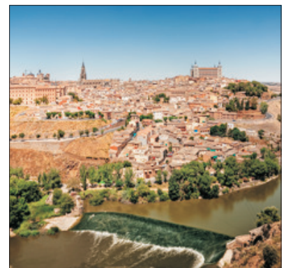
「中世紀的足跡」 杜麗多古城

位於山崗上之阿爾罕布拉宮，被譽為最美麗的摩爾式建築物，宮內亭台樓閣，盡顯摩爾藝術之特色。