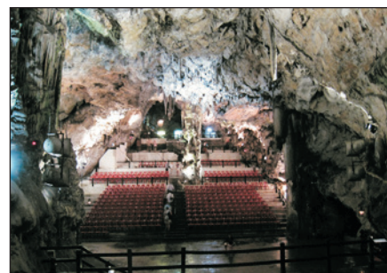
聖米高鐘乳石洞 St.Michael Cave