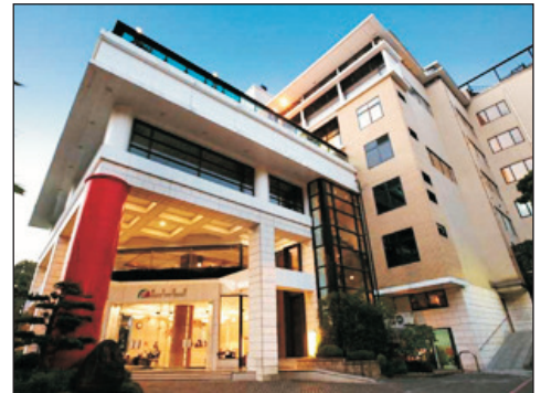
北投春天溫泉酒店

《限定出發：9月1,3,16,25日，10月1,6,15,29日， 11月5,11,18,24日》