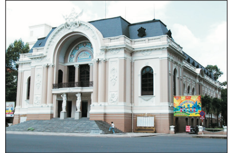
法國風情的市立歌劇院

古芝地道、戰爭博物館、湄公河三角洲、熱帶水果園、耶穌山、 鯨魚廟、Vincom Center、歷史博物館、3D視覺美術館