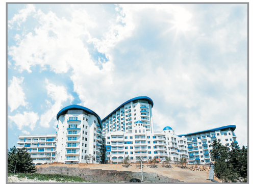
【獨家】三陟Sol Beach Hotel & Resort