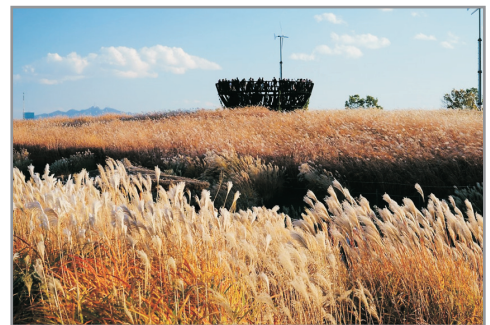
《增遊》首爾天空公園(賞紫芒草註1) (10月1日至11月20日出發團隊適用)