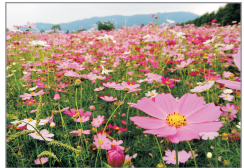
《增遊》九里漢江公園(賞波斯菊註1) (9月15日至30日出發團隊適用)