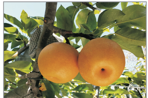
《增遊》羅州梨果園(每位客人品嚐羅州梨乙個) (10月20日至11月5日出發團隊適用)