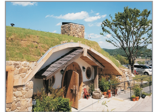
天安麵包主題小鎮

保肝專門店—通仁市場《特別安排》每位客人傳統 銅錢韓元5000品嚐地道小吃—明洞購物區—韓食 土產店—仁川→香港