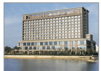
昇恆昌金湖大酒店