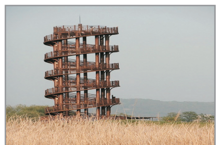
《男朋友》 始興河溝生態公園