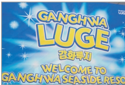
江華島LUGE斜坡滑車體驗