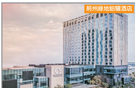
荊州綠地鉑驪酒店