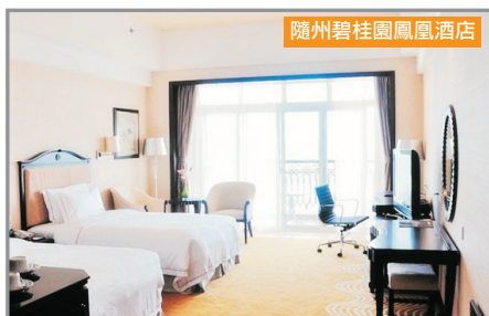
隨州碧桂園鳳凰酒店

荊州《保證入住》荊州綠地鉑驪酒店：由綠地國際酒店管理集團管理，地處荊楚古城北部新區，酒店位置絕佳，距荊州古城牆只需約5分鐘車程，其客房設計時尚舒適，面積約43平方米起。