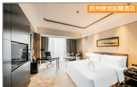
荊州綠地鉑驪酒店