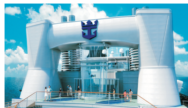
Ripcord by iFly海上跳傘體驗®*