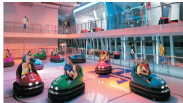
SeaPlex海上多功能運動場*