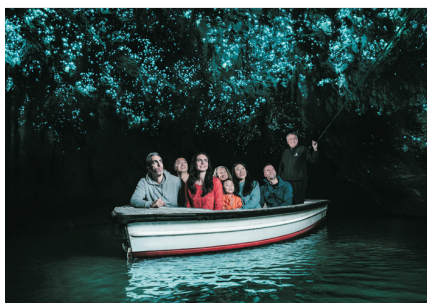
懷托摩鐘乳石及螢火蟲洞