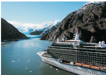
冰川峽灣國家公園