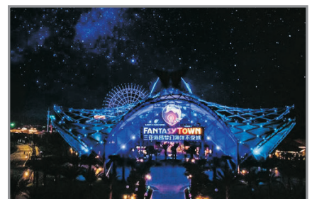
海昌夢幻海洋不夜城

Day 3 三亞—三亞五星級最美特色民族村寨~中廖村(包電瓶車) 【中和湖、黎夫彩園、黎家小院】、—亞龍灣愛立方濱海樂園—海昌夢幻海洋不夜城(觀賞夜景) ~亞龍灣愛立方濱海樂園：以濱海旅遊為主題，從山到海，擁有世界級熱帶海岸、圖騰柱水景文化廣場等。