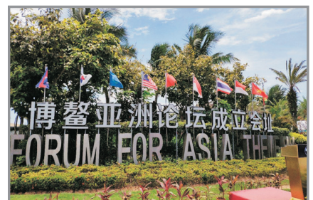
博鰲亞洲論壇成立會址

Day 2 興隆—博鰲亞洲論壇成立會址—椰田古寨—三亞 ~博鰲亞洲論壇成立會址：東臨南海，空氣清新，是當年博鰲亞洲論壇成立之主會場，並每年定期於此舉行會議。更被評為「海南省十佳旅遊區」之一。