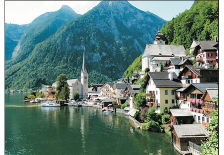
哈爾施塔特(自費參加)