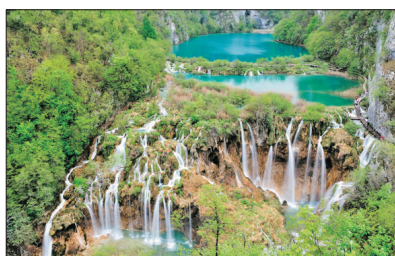
「世界自然遺產」 十六湖國家公園

有「歐洲九寨溝」美譽，湖水顏色蔚藍、彩綠，變化萬千，大大小小的美麗湖泊，加上茂密森林、清澈河流、秀麗瀑布，整個公園就猶如一幅美得令人心動的山水名畫。