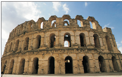
埃爾杰姆羅馬競技場

突尼西亞是世界上少數幾個集中了沙灘、沙漠、山林和古文明的國家。被認為是悠久文明和多元文化的融和之地。這裡匯集了地中海地區所有的古文化遺蹟，建築寺廟、民間風俗。更是古羅馬時代迦太基王國的所在地，深受阿拉伯與伊斯蘭文化的影響。1881年被法國征服成為拿破崙的海外藩屬之一，最後在1956年脫離法國獨立成為今日的突尼西亞共和國。