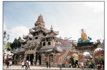
不一樣的寺廟~靈福寺