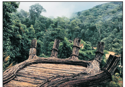
大叻農舍(巨型幸運之手)