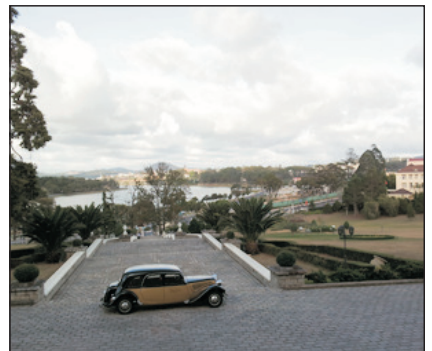
Dalat Palace Heritage