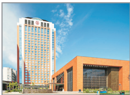
呼和浩特喜來登酒店