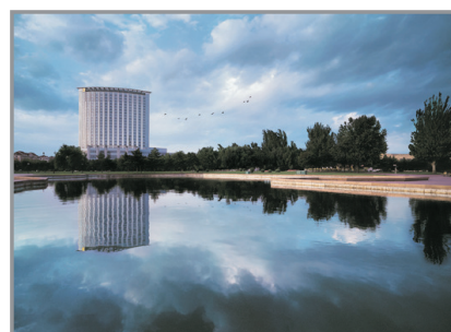
包頭香格里拉大酒店