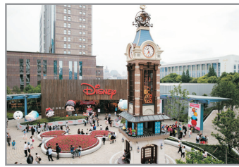
上海迪士尼旗艦店