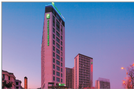
上海中茂世紀智選假日酒店