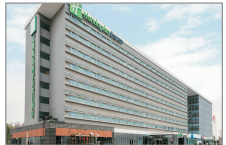
上海新虹橋智選假日酒店