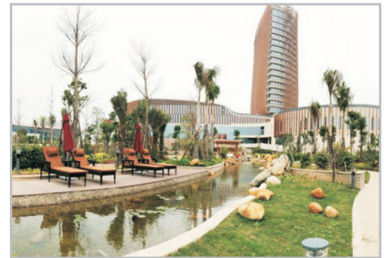
佰翔圓山溫泉酒店