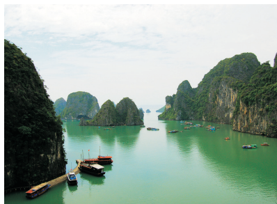
下龍灣海上風景區