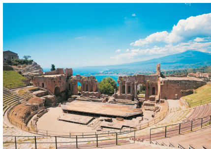
陶納米山城(意大利)