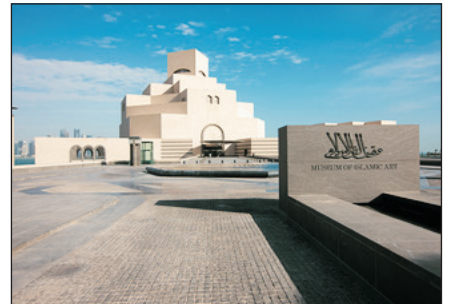
伊斯蘭藝術博物館