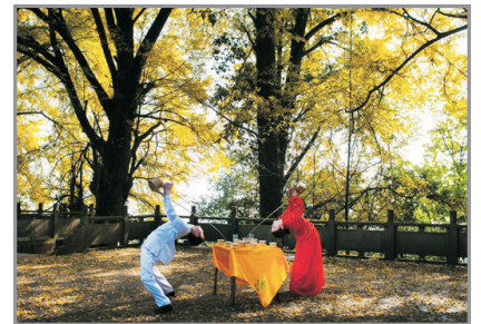
獨家安排龍行十八式茶技表演 (10月15至11月15日出發團隊增遊)

海螺溝—瀘定縣—古代入藏咽喉要道~瀘定橋(康熙御筆題名)—雨城~雅安(昔日茶馬古道重鎮)—成都—春熙路商業步行街—IFS國金中心巨型熊貓(外觀)—網紅打卡地~成都遠洋太古裡休閒購物區 *海螺溝往瀘定橋車程約1小時；瀘定橋往成都車程約4小時。