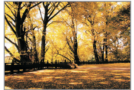
蒙頂千年銀杏十二釵 (10月15至11月15日出發團隊增遊)

中國唯一國家冰川森林公園~海螺溝國家級風景名勝區(世界同緯度海拔最低、最大之現代冰川，國家5A級景區，國家地質公園，國家地理雜誌評選中國最美十大名山之一、包公共環保接駁車往返)—特別重本安排乘坐高空觀景纜車往返(空中欣賞中國最高大之冰川瀑布、蜀山之王~貢嘎雪山、舉世罕見之冰川森林共生奇景)—零距離接觸冰川世界—貢嘎紅石之谷~燕子溝風景區(全世界紅石最多最集中的地方之一，包公共環保接駁車往返)—天下第一紅石灘—天藥水坪—定海神針—下十里仙境 *海螺溝往燕子溝車程約40分鐘。