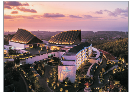
Renaissance Bali Uluwatu Resort and Spa