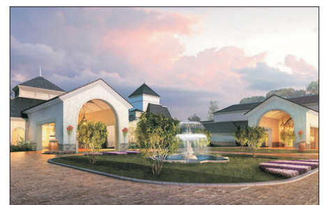
懷來皇冠假日酒店