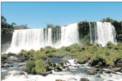
【見證自然力量】 伊瓜蘇大瀑布(巴西)

重本安排乘直昇機空中鳥瞰被譽為南美洲一大奇觀【伊瓜蘇大瀑布】。其萬馬奔騰般的湍急水流，雷鳴般的衝擊聲浪，掀起的水霧在陽光的照射下，演變成七彩的彩虹色調。