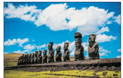
【觀賞古怪雕像】 智利～復活節島

1983年獲聯合國教科文組織列為世界遺產的馬丘比丘『天空之城』，這兒見證了印加帝國的光輝，一座極繁榮興盛的城市，在沒有車船知識時代的建築奇蹟。