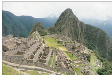
【遊覽天空之城】 馬丘比丘古城

重本安排乘直昇機空中鳥瞰被譽為南美洲一大奇觀【伊瓜蘇大瀑布】。其萬馬奔騰般的湍急水流，雷鳴般的衝擊聲浪，掀起的水霧在陽光的照射下，演變成七彩的彩虹色調。