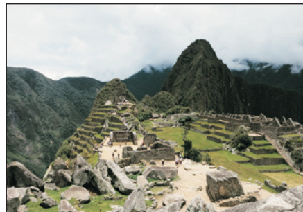
空中之城~馬丘比丘