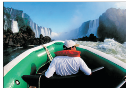
乘坐橡皮艇穿梭瀑布邊緣