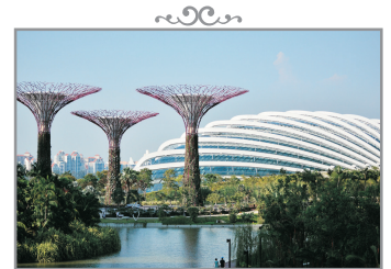
Gardens by the Bay~ Flower Dome & Cloud Forest Dome