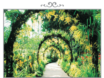
新加坡植物園 Botanic Gardens