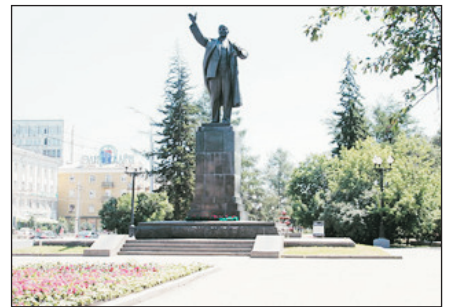
伊爾庫茨克列寧廣場