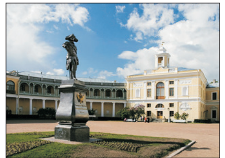
巴甫洛夫斯克皇宮