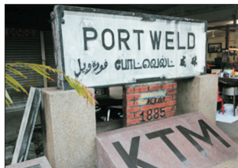
馬來西亞第一條鐵路遺跡