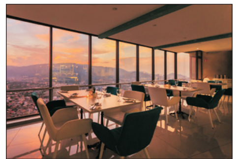
59 Top View空中餐廳