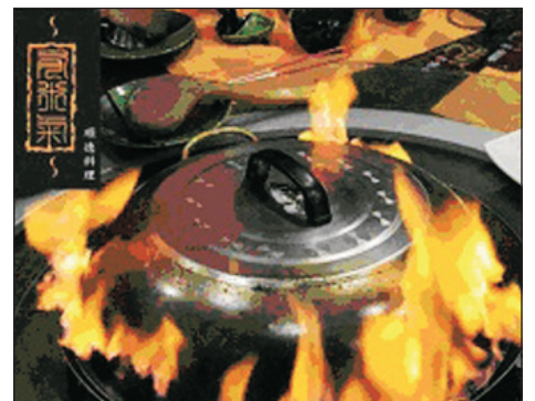
順德菜~太古火焰鍋