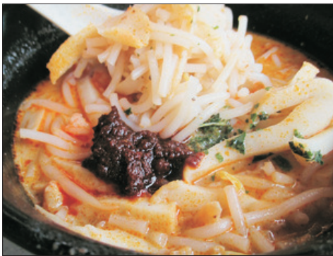
【米芝蓮推介】 👉 「328加東叻沙」

叻沙是新加坡「國寶級」的小食，糅合了中國與馬來西亞煮食文化，而「328加東叻沙餐廳」在新加坡早已成名，以咖喱和椰奶熬煮的秘製湯底，加上豐富的海鮮配料，香味十足。