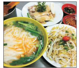
👉 陳東記沙河粉+芽菜雞