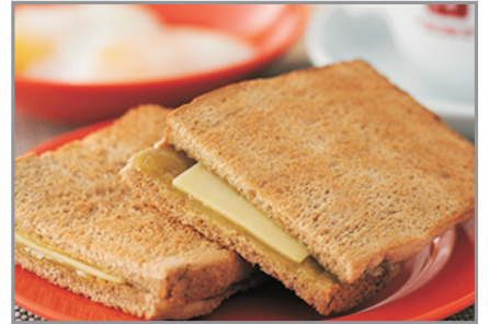
亞坤咖央多士配地道咖啡或香滑奶茶

數碼港(未來之城)、【世界文化遺產】馬六甲古城、 野生動物生態園River Safari、Gardens by the Bay濱海灣花園、 「新加坡蘭桂坊」克拉碼頭、獅頭魚尾像、牛車水