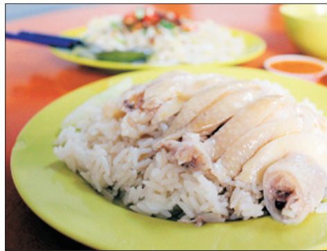
【米芝蓮推介】 👉 「天天海南雞飯」

叻沙是新加坡「國寶級」的小食，糅合了中國與馬來西亞煮食文化，而「328加東叻沙餐廳」在新加坡早已成名，以咖喱和椰奶熬煮的秘製湯底，加上豐富的海鮮配料，香味十足。