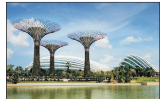
Gardens by the Bay濱海灣花園