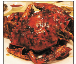
👉 亞一海鮮餐廳 招牌黑胡椒炒蟹