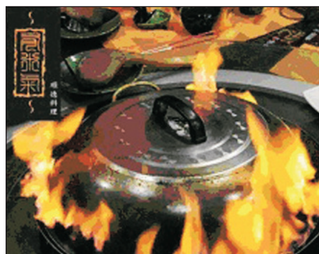
順德菜~太古火焰鍋