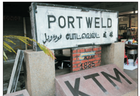
馬來西亞第一條鐵路遺跡