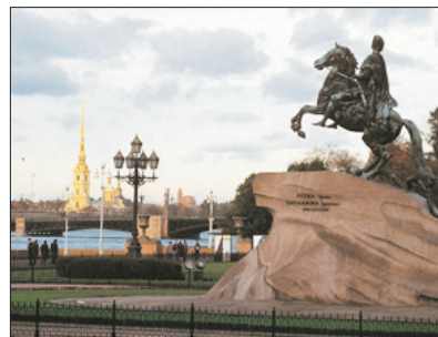
「北方威尼斯」 聖彼得堡

是俄羅斯的首都及最大的城市，為全國政治、經濟、科學、文化及交通的中心，當中位於莫斯科河邊的紅場及克里姆林宮更是俄國歷代帝王權力的象徵，極具歷史意義。