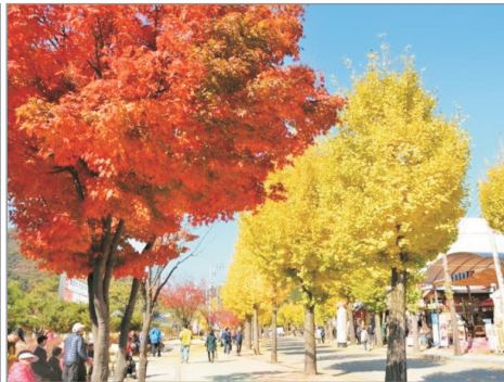
聞慶鳥嶺道立公園