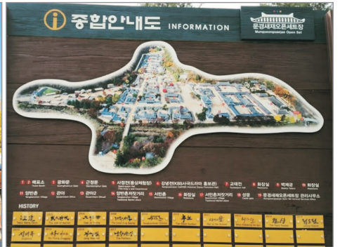
聞慶KBS開放式攝影場