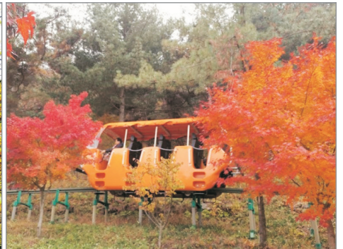
Ecology Land~ Monorail單軌車體驗