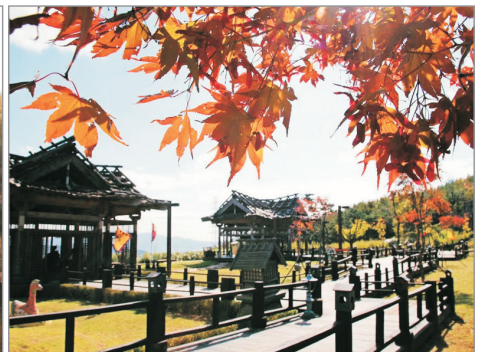
金海伽倻主題公園