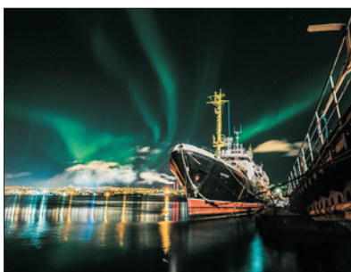
「極地的首都」 摩曼斯克

位於俄羅斯西北部的科拉半島，是摩爾曼斯克州首府、北冰洋沿岸最大港市及北極圈內最大的城市。由於地處北緯69度(北極圈內300多公里)的位置，這裡觀賞到北極光的機率十分高。