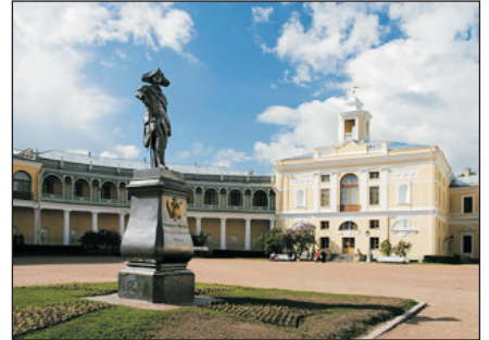
巴甫洛夫斯克皇宮

Murmansk→(By Flight)→St.Petersburg-Pavlovsk Palace(Internal Visit)-Optional Tour • 巴甫洛夫斯克皇宮 ：是聖彼得堡的皇家園林，被視為18世紀末、19世紀初俄羅斯古典主義藝術的傑作，也被聯合國教科文組織列為「世界遺產」的歷史遺跡。