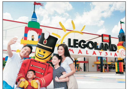
亞洲首座樂高樂園(Legoland) (包入場及任玩套票)