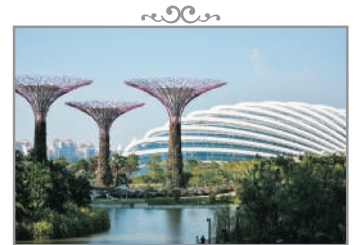
Gardens by the Bay~ Flower Dome & Cloud Forest Dome