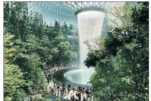
世界最高的室內瀑布