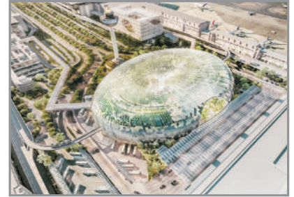
全新開幕~ 新加坡機場「星耀樟宜」

Resort World Sentosa、環球影城™、Gardens by the Bay濱海灣花園、 S.E.A.海洋館、克拉碼頭+觀光遊覽船、植物園、國家蘭花公園、 《全新開幕》星耀樟宜~世界最高的室內瀑布~雨漩渦