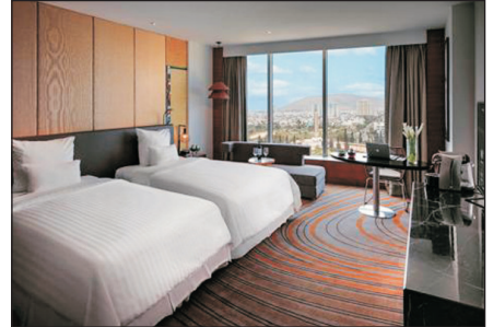
Pullman Vung Tau Hotel

古芝地道、戰爭博物館、湄公河三角洲、熱帶水果園、耶穌山、鯨魚廟、Vincom Center、歷史博物館、3D視覺美術館、統一宮