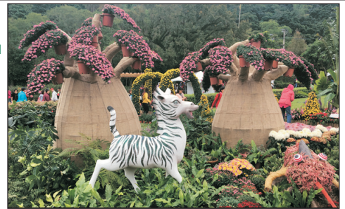
增遊士林官邸秋季菊展

下田拔蔥(蔥油餅DIY)、七星潭、總統府、上引水產、林口三井Outlet、士林夜市