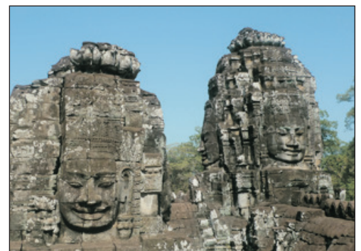
吳哥窟遺跡~ 四面巴戎佛